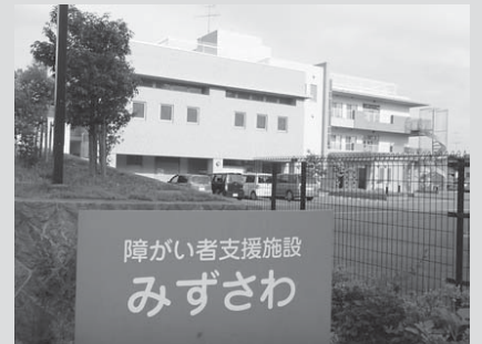
▲市内で新築最後の入所施設にしてはならない

小規模の入所施設の整備も施設整備時の国からの補助金のあり方など、一刻も早く確定するよう働きかけていきます。