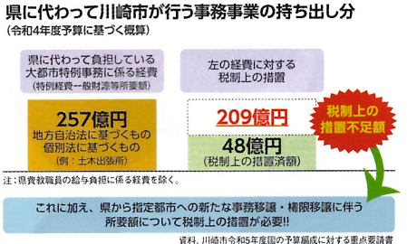
注: 国費転付の給付負担に係る経費を除く。

ているという現実があります (図参照)。川崎市が県から独立し、市域からの県税もすべて徴収する仕組みが「特別市」です。まず「特別市」を実現して、市民が「納税により生活環境が向上する」と実感できる自治体運営を何としても実現したいのです。そしてこれが、持続可能な川崎市の活力にもつながると信じるからです。